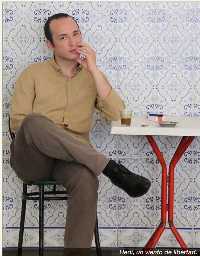
Hedi, un viento de libertad.