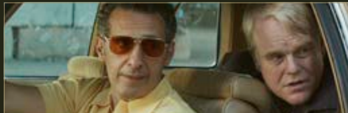
John Turturro & Philip Seymour Hoffman · El misterio de God's Pocket.

Reperto: Philip Seymour Hoffman, Richard Jenkins, John Turturro