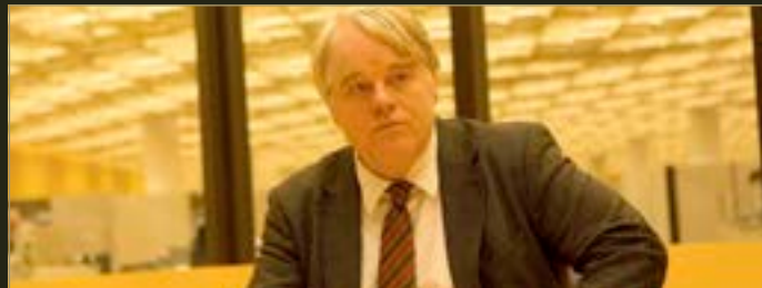
Philip Seymour Hoffman · El hombre más buscado.

Reperto: Philip Seymour Hoffman, Willem Dafoe, Rachel McAdams